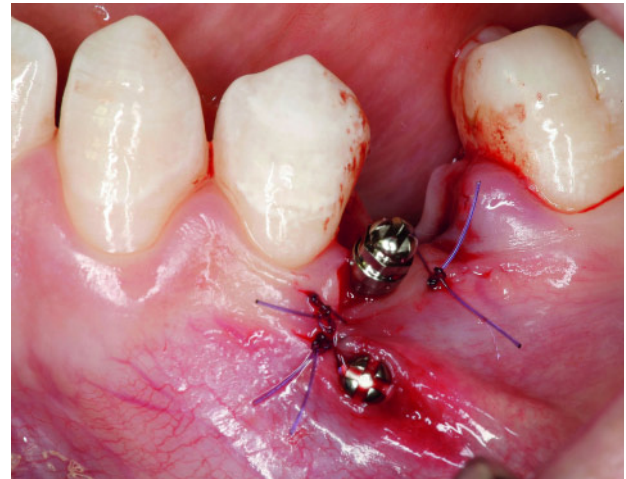
Abbildung 2 Zwei Mini-Schraubenimplantate vestibulär distal Regio 34 zur kortikalen Verankerung bei geplanter Mesialisierung der Molaren unmittelbar postoperativ.

Figure 2 Two miniscrew implants buccodistal region tooth 34 for cortical anchorage with planned mesialization of the molar immediately postoperatively.